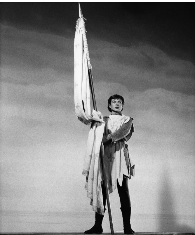
Hedy Lamarr dans « The Story of Mankind » de I.Allen, 1957